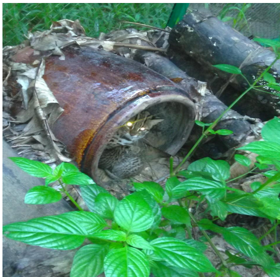
Hình 2: Giai đoạn rất dễ bị mèo mẹ “ăn con” nếu có những ức chế xảy ra cho chúng, ví dụ, tiếng ồn; lại quá gần.

Đây là lần đầu tiên Mèo rừng được sinh sản thành công tại Trạm Bảo tồn Động vật hoang dã Dầu Tiếng – tỉnh Bình Dương. Chúng đang được cho uống sữa và phơi nắng hàng ngày. Những năm trước đó, chúng tôi cũng đã thành công khi gần 10 cá thể con non của loài Mèo rừng này được sinh ra tại Trạm cứu hộ động vật hoang dã Củ Chi – thành phố Hồ Chí Minh. Mèo rừng, tên khoa học là Prionailurus bengalensis , là loài động vật hoang dã nguy cấp, quý, hiếm được liệt kê bảo vệ theo Nghị định : 06/2019/NĐ-CP ngày 22/1/2019 của Chính phủ.