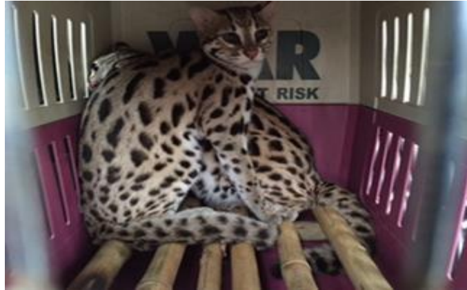
Figure 1: A pair of Leopard cats handed over to The Dau Tieng Conservation Station.

There are two cubs of Prionailurus bengalensis , born at Dau Tieng Wildlife Conservation Station at the end of September. The parents of these cubs were handed voluntarily by a local people in previous two weeks. Thank you The Forest Protection Department of Dau Tieng District and Binh Duong province to cooperate with WAR on saving these wildlife. This is the first time, the Dau Tieng Wildlife Conservation Station welcome these cubs and we hope the good news will continue occur in future.