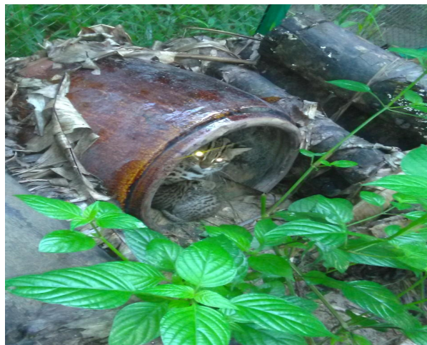
Figure 2: This sensitive time to the species if there is any stress occurred, e.g. noise, strangers' approach closely.

The species is protected and listed in the Decree: 06/2019 / ND-CP dated January 22, 2019 of the Government of Vietnam.